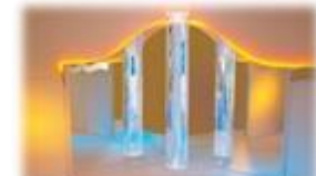
Wassersäule lädt zum Erforschen ein

Beim Snoezelen werden alle Grundwahrnehmungsbereiche angesprochen, wie Gleichgewicht, Geschmack, Gehör, Geruch, Tiefensensibilität und Sehen. In Einheit von Licht,