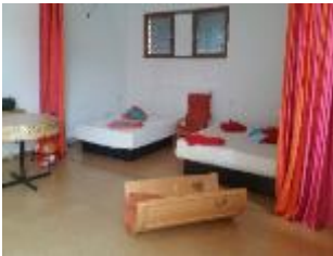
Unser Entspannungsraum zurzeit.

Unsere Kinder sind im Alltag häufig vielen Reizen ausgesetzt. Das soziale Umfeld hat einen großen Einfluss auf eine gesunde Entwicklung.